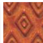
A-61 [O] [TP] Moss Brown