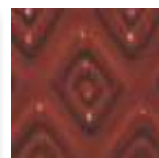
A-52 [O] [TP] Old Brick