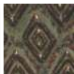
A-28 [O] [TP] Peacock