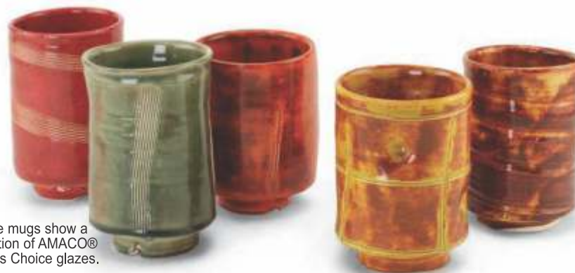
These mugs show a selection of AMACO® Artist's Choice glazes.

[O]=Opaque - krycí [TP]=Transparent - transparentní [TL]=Translucent - průsvitný [ST]=Semi-Translucent - částečně průsvitný [SO]=Semi-Opaque - částečně krycí