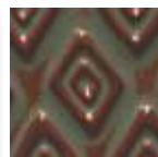
A-43 [O] [TP] Green Float