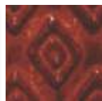
A-34 [O] [TP] Sand Bar