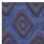
A-24 [O] [TP] Exotic Blue