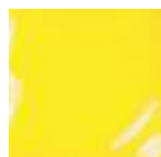
SS-204 [O] [TP] Daodil Yellow