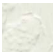
➤ LG-11 [O] (☑) Opaque White