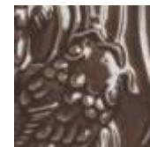
➤ LG-30 [TL] (☑) Chocolate Brown