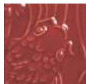
➤ LG-57 [TL] (☑) Intense Red