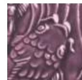
➤ LG-55 [TP] (☑) Purple