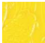
➤ LG-63 [TL] (☑) Brilliant Yellow