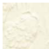
➤ LG-10 [TP] (☑) Clear Transparent