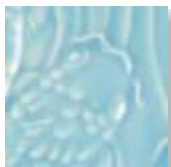
➤ LG-24 [TP] (☑) Light Blue