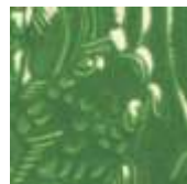
➤ LG-48 [O] (☑) Chrome Green