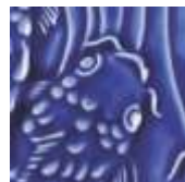
➤ LG-21 [TP] (☑) Dark Blue