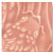
➤ LG-52 [TP] (☑) Petal Pink