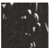
➤ LG-32 [O] (☑) Metallic Brown