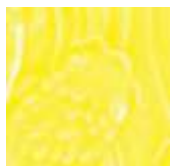
➤ LG-61 [TL] (☑) Canary Yellow