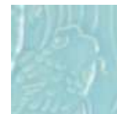
➤ LG-23 [TP] (☑) Robins Egg