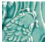
➤ LG-26 [TP] (☑) Turquoise