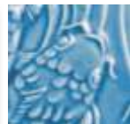
➤ LG-27 [TP] (☒) Turquoise Crackle