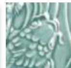
➤ LG-25 [TP] (☑) Turquoise Green