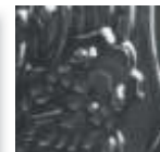
➤ LG-2 [O] (☑) Black Lustre

[O]=Opaque - krycí [TP]=Transparent - transparentní [TL]=Translucent - průsvitný [ST]=Semi-Translucent - částečně průsvitný [SO]=Semi-Opaque - částečně krycí