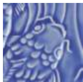
➤ LG-20 [TP] (☑) Medium Blue