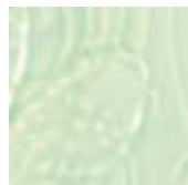
➤ LG-42 [TP] (☑) Light Green