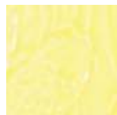
➤ LG-760 [TL] (☑) Pale Yellow